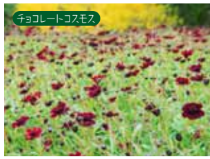
チョコレートコスモス

まるで本物のチョコレートのような甘い香りと色を楽しむことのできるチョコレートコスモスは約1000株咲き誇ります。黄金アカシアはエリア内に約1000本群生は日本でもここだけ。紅葉のシーズンになると太陽に照らされた葉が、黄金色に光輝く別世界です。